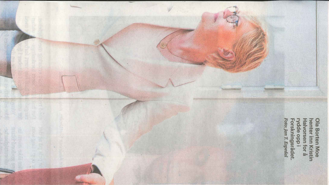
Ola Borten Moe henter inn Kristin Halvorsen for å rydde opp i Forskningsrådet.