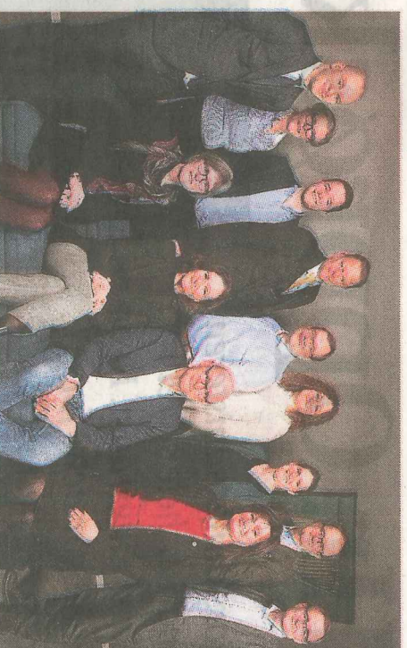
Styret i Forskningsrådet fikk onsdag beskjed om at de må gå.

Ola Borten Moe, forsknings- og høyere utdanningsminister (Sp)