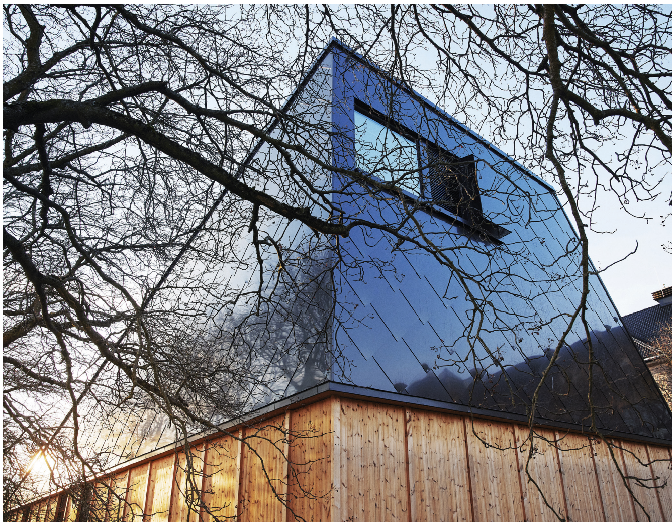
Klimahuset er et av Norges mest miljøvennlige bygg og er ett av forbildeprosjektene hos FutureBuilt. Store deler av taket er dekket av solpanel.

Klimahuset er bygget på en måte som gir minst mulig miljøbelastning og klimagassutslipp og er premiert som et forbildeprosjekt i FutureBuilt.