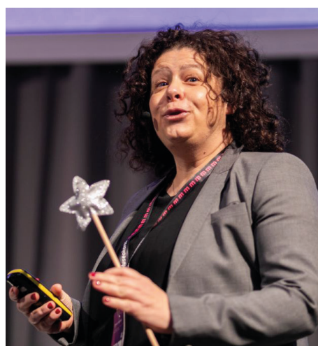
Network of European Museum Organisations (NEMO)