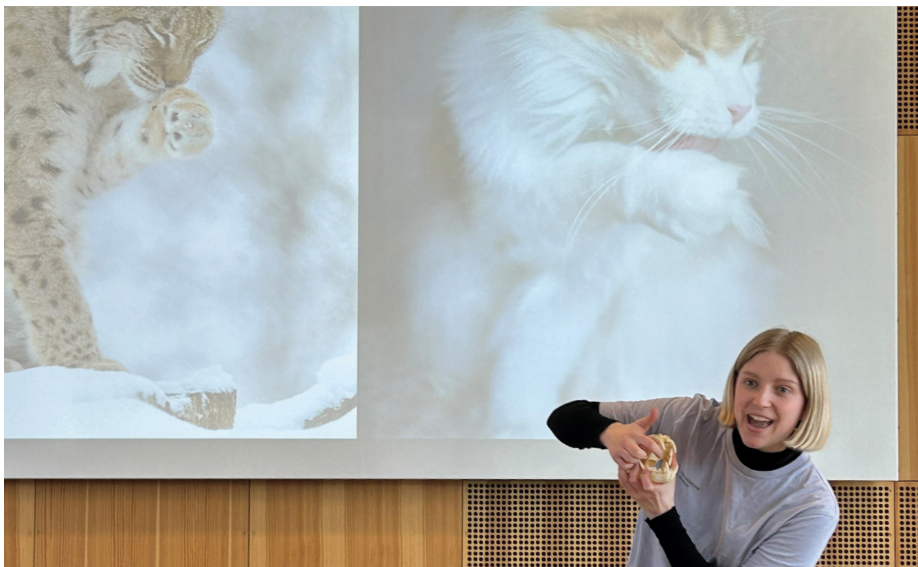
Gaupa var et av dyrene publikum fikk bli bedre kjent med på Naturvitensshow: Dyr i trøbbel. Her viser en av vertene frem en modell av en gaupeskalle.

I 2023 arrangerte vi naturvitensshowet Dyr i trøbbel i flere av skolens ferier, og hver dag i juli. Her ble publikum kjent med fem dyr i norsk natur som har det vanskelig på grunn av klima- og arealbruksendringer. Publikum fikk også tips til hvordan de selv kan hjelpe truede dyr.