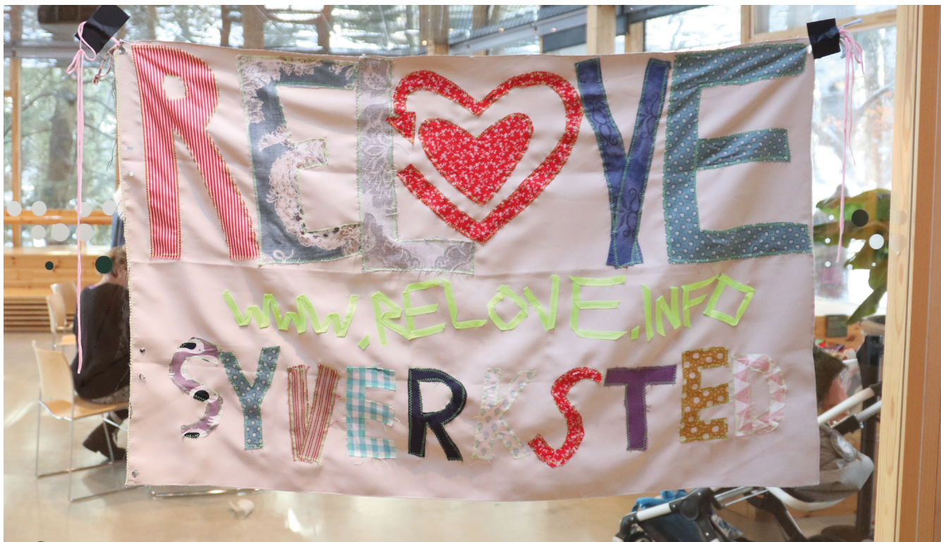
På Skaperverksted i Klimahuset kunne publikum blant annet sy klær til karneval av tekstilrester.

I noen av årets ferier og helgedager har Klimahuset arrangert skaperverksted blant annet med inspirasjon fra museets utstillinger og utstrakt gjenbruk av materialer. Verkstedene hadde mål om at publikum skulle utfordre sine kreative sider samtidig som de lærte noe om natur, klima og miljø. Deltakerne laget egne dioramaer med inspirasjon fra dyr i norsk natur og presenterte ideer om hvordan fremtidens dyr ville kunne se ut. I syverkstedet var omsøm tema.