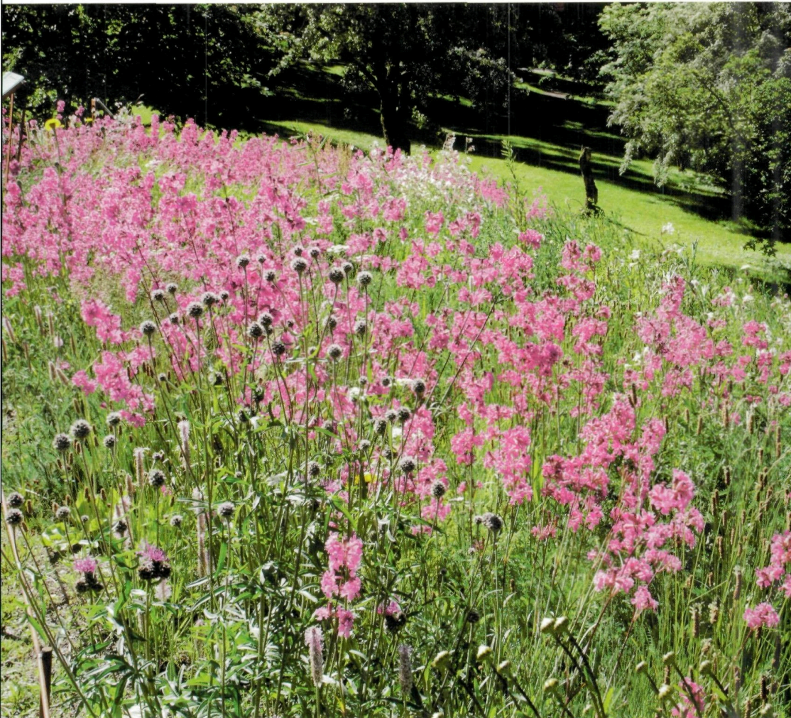
TØRKETÅLENDE Der enga er tørrest dominerer engtjæreblom.