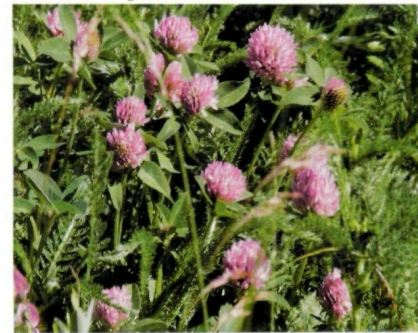
1 Rødkløver 2 Flekkgriseøre

– For insektene er det heller ikke viktig at artene kommer fra nærrområdet. Men for meg som er biolog er det viktig. Jeg anbefaler alltid å bruke stedeagne frø,