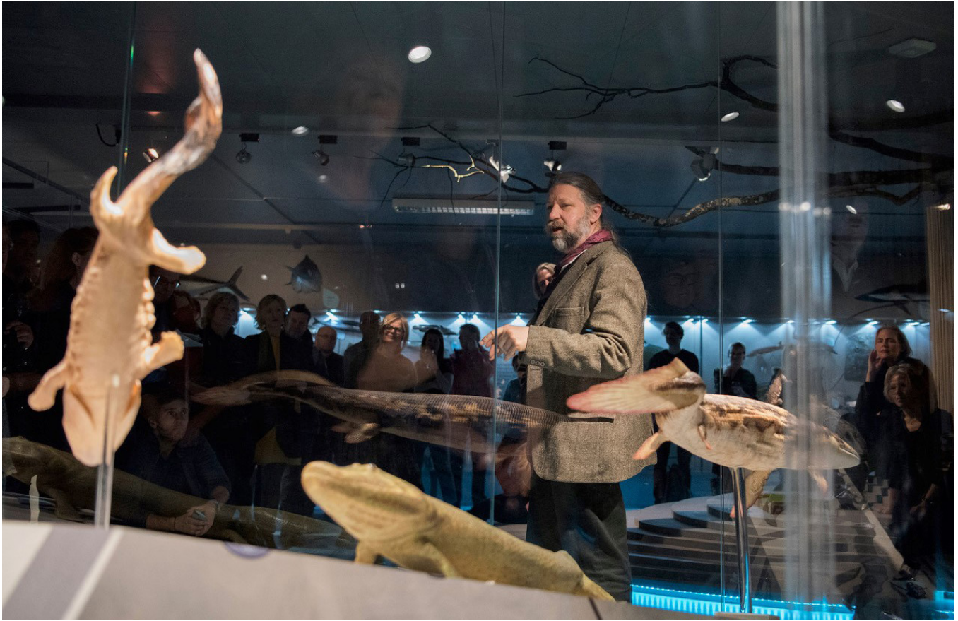
Åpning av utstillingen "Livets tre".