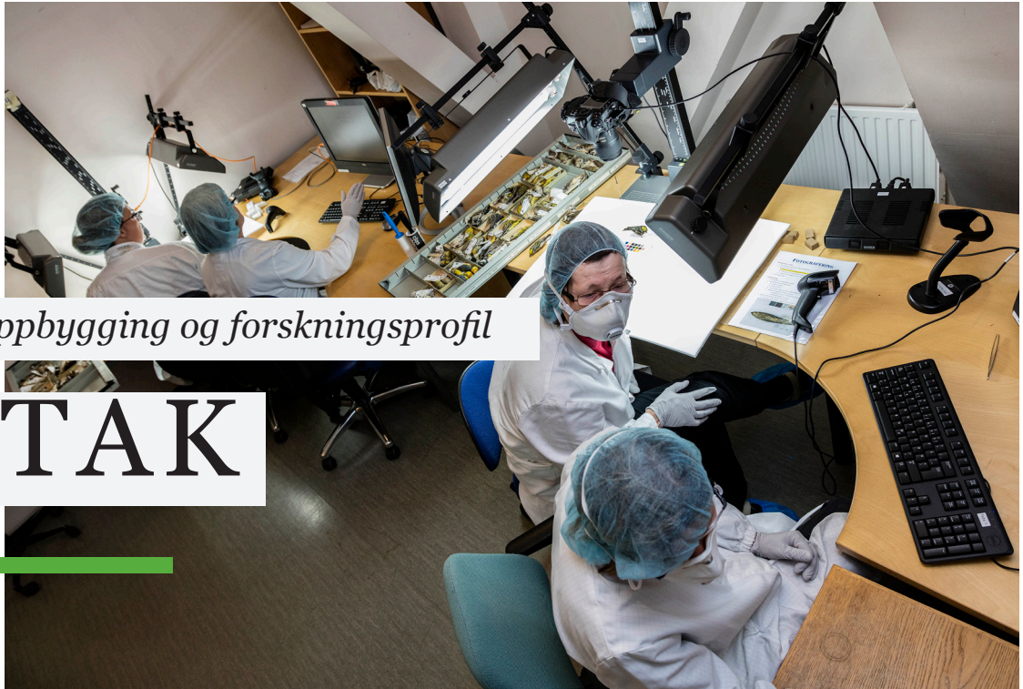
Fotodugnad i fuglesamlingen.