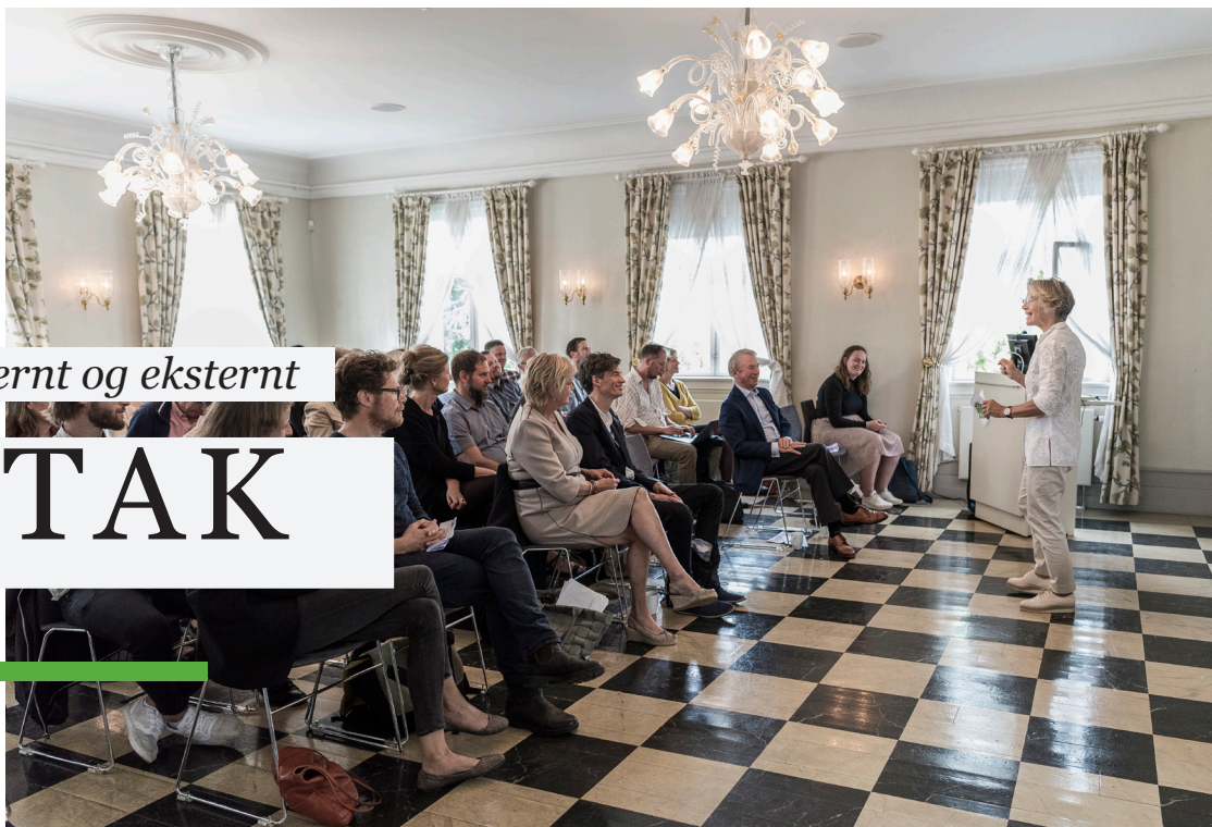
Arrangement i Salen.