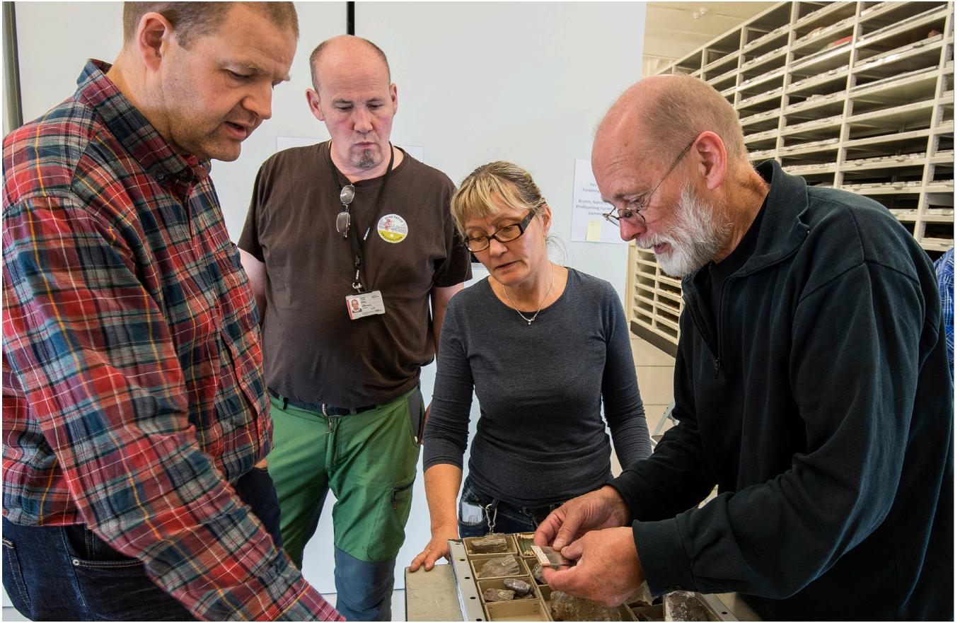
Fotodugnad på Økern.