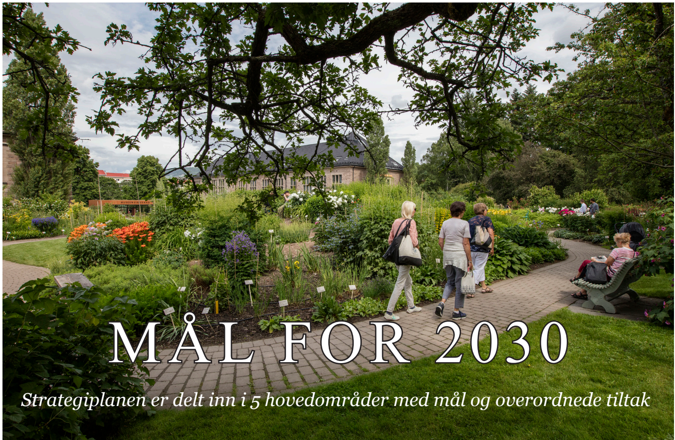
Utsikt mot Broggers hus.