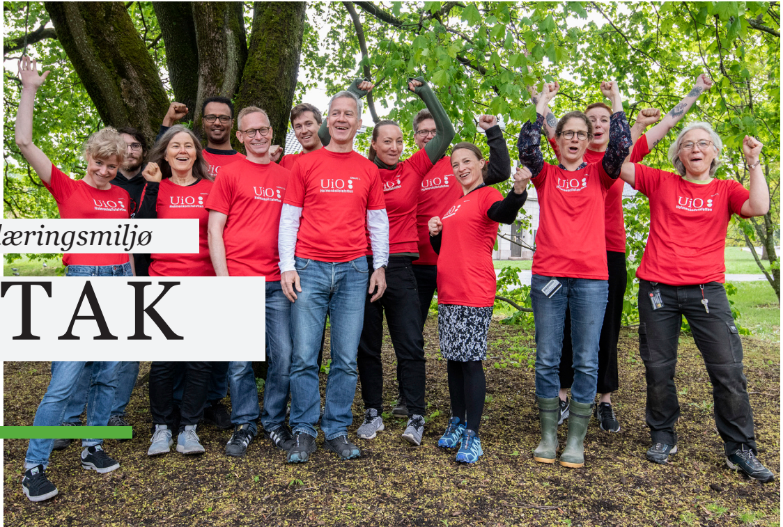
NHMs Holmenkollstafettlag.