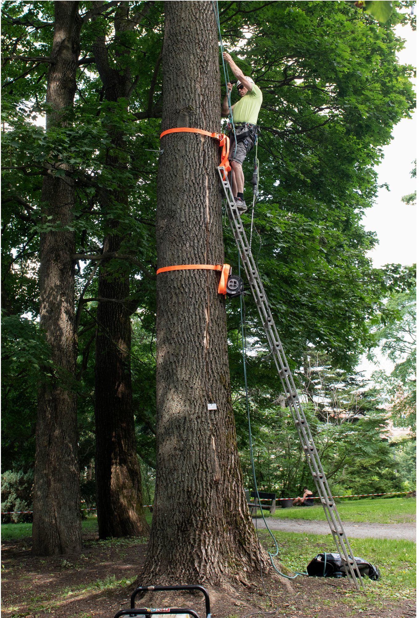
Spjelking av Ask.