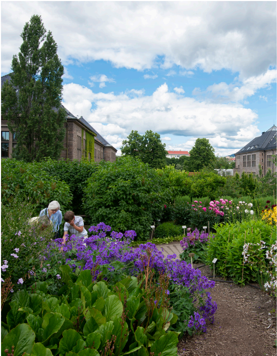
Oldemors hage.